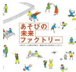
あそびのアイデアソン